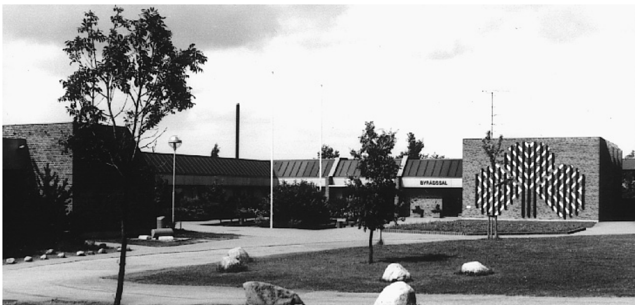
Ledøje-Smørum rådhus, 1980

byggede man fortrinsvis på frie grundarealer i de mindre byers udkant, mens man i købstæderne søgte at lade administrationen forblive i centrum.