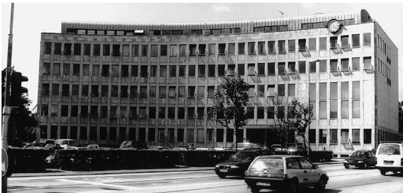
Lyngby-Taarbæk rådhus, 1941

munale administration er spredt ud over hele byen (som for eksempel i Kalundborg), har jeg valgt at lade kommunen repræsentere via den bygning, der huser centraladministrationen, borgmesteren og kommunaldirektørens kontorer, samt, så vidt muligt, byrådssalen. Med andre ord: den kommunale administrations hjerte.