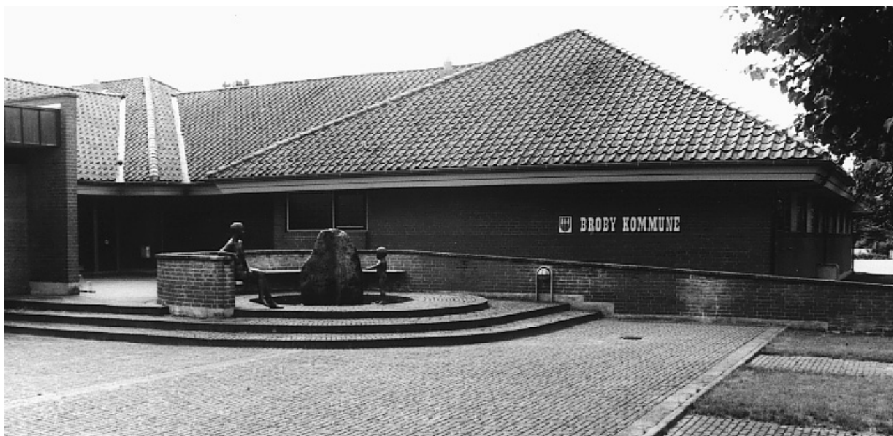
Broby rådhus, 1983

kommunalbestyrelser er et udbredt fænomen. Samtidig skal det nævnes, at der også i forbindelse med de konkurrence-fundne arkitekter kan være tale om alt andet end vovemod; i mange tilfælde er der tale om 'omvendte' konkurrencer, hvor man vil have mest muligt for en begrænset sum penge med fokus på funktionen frem for æstetikken.